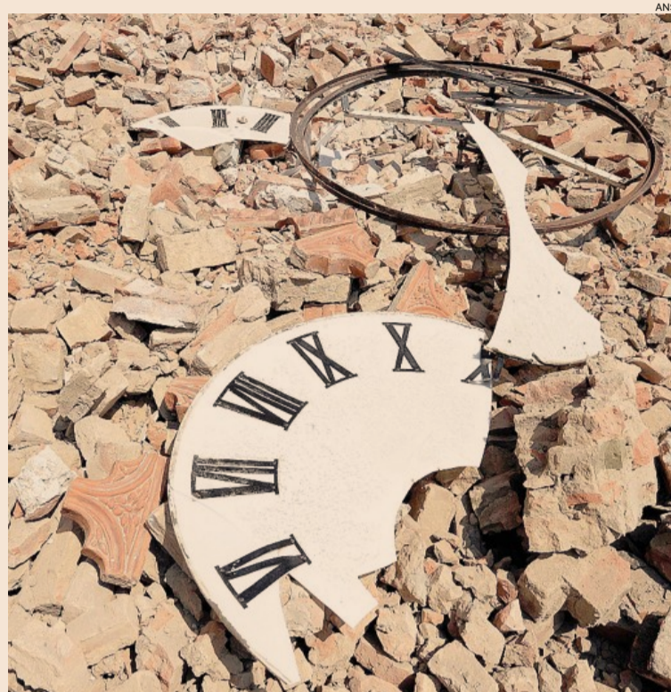
Dal sisma alla rinascita. La città di Mirandola colpita dal terremoto nel 2012, oggi è in prima linea nella produzione biomedicale.