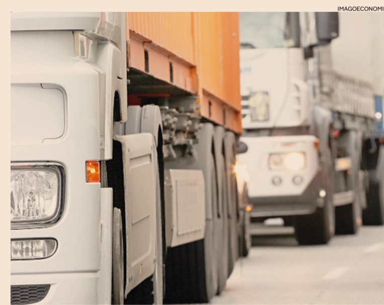
Carenze. Il collegamento veloce a 4 corsie tra la A22 e la A13 è una chimera dal 1986

I grillini hanno fatto il possibile per bloccare l'opera a ogni livello istituzionale, senza ufficialmente riuscirvi visto che la competenza è regionale. L'ente è da sempre colorato di rosso e il Pd non ha mai avuto ripensamenti sulla strategia del tracciato di 67 chilometri tra il casello di Reggio sull'Autobrennero e la barriera di Ferrara sud e 4 caselli (Mirandola, Finale Emilia, Cento, Poggio Renatico) per liberare la Bassa Modenese da code bibliche di camion, un investimento da 1,32 miliardi, lievitato nel corso degli anni a causa delle lungaggini tanto che sia Regione sia la società con-